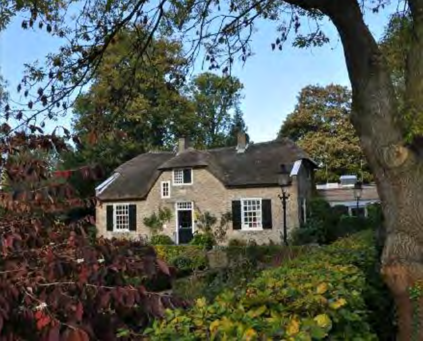
Restaurant 'In den Rustwat'