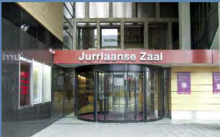
De Doelen, entree