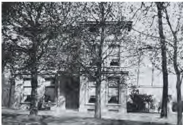
De buitenplaats Stadwijk