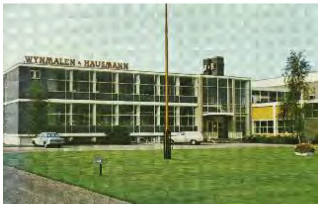
Het nieuwe kantoor van Wynmalen & Hausmann in Bunnik