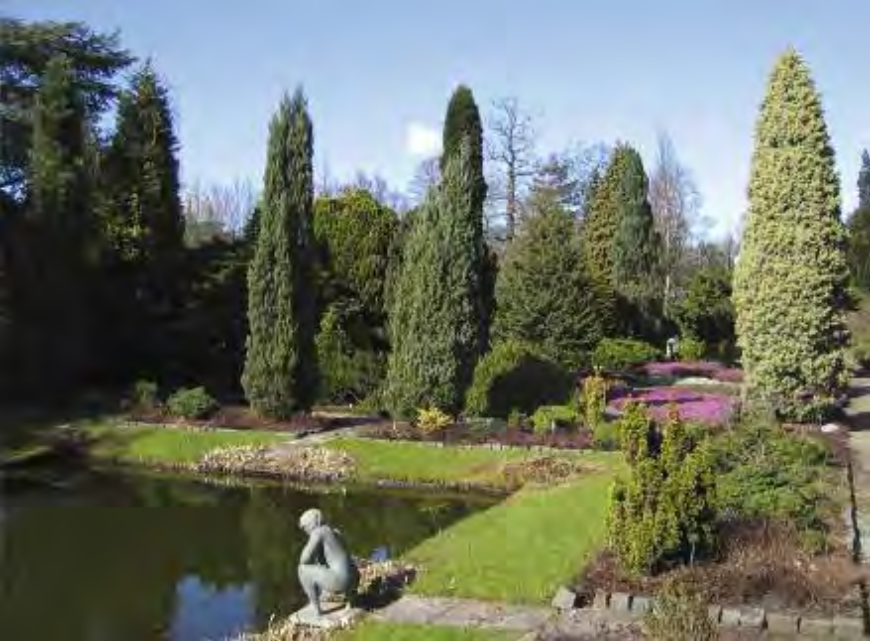
Arboretum Trompenburg