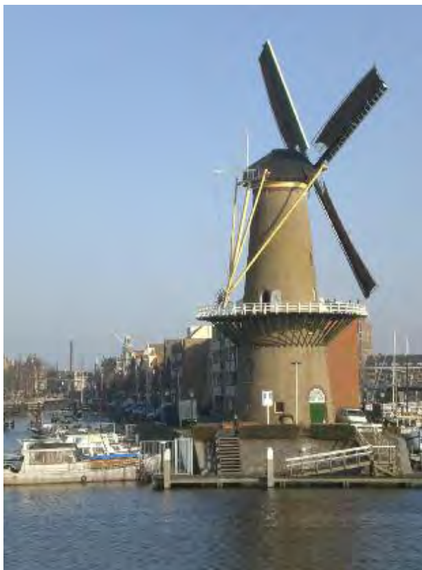
Molen 'de Distilleerketel'